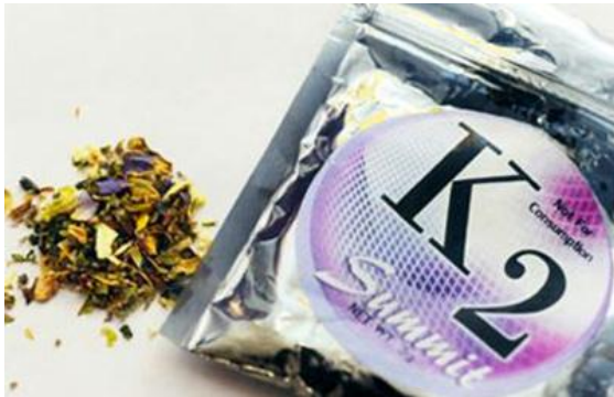
K2, una marca popular de Spice.

Algunos de los productos del Spice se venden en forma de "incienso", pero se parecen más al popurrí. Al igual que la marihuana, la manera más común de consumir el Spice es fumándolo. A veces el Spice se mezcla con marihuana o se prepara como una infusión o té de hierbas para beber.